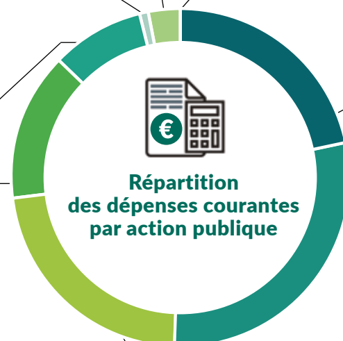
Répartition des dépenses courantes par action publique