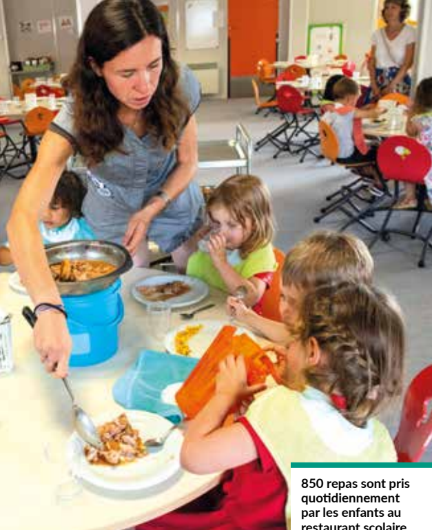
850 repas sont pris quotidiennement par les enfants au restaurant scolaire.