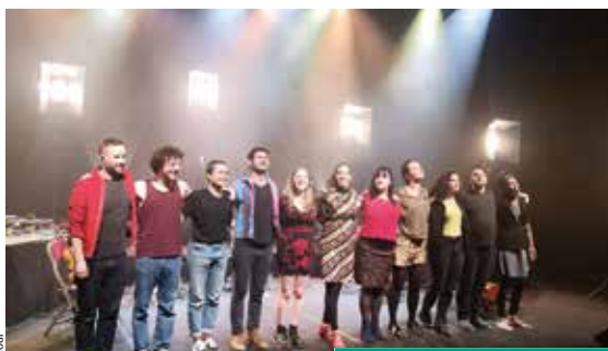
Plus de 7000 spectateurs ont assisté aux différentes représentations de la salle de spectacles du Centre culturel le Dôme l'an dernier.